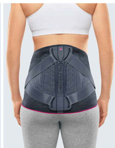
Приталенный покрой бандажа