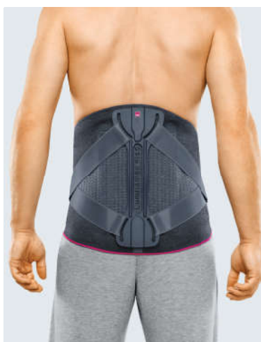
Прямой покрой бандажа

Прямой покрой рекомендован во всех случаях, когда P < W , а также при отсутствии большой разницы между окружностью на уровне тазовых костей P и окружностью талии W (менее 3 см).