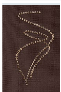
Золотой ветер (Wind in gold)

Доступно для модельных рядов mediven elegance, mediven comfort, mediven plus, mediven forte, а также для всех модельных рядов плоской вязки.