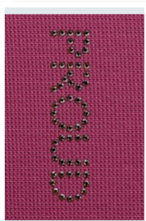
Благородный антрацит (Proud in anthracite)