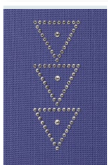
Серебряное трио (Trio in silver)