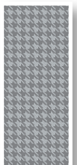
Гусиная лапка (Classic)